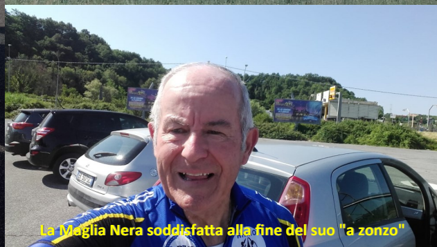
La Maglia Nera soddisfatta alla fine del suo "a zonzo"