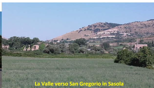
La Valle verso San Gregorio in Sasola