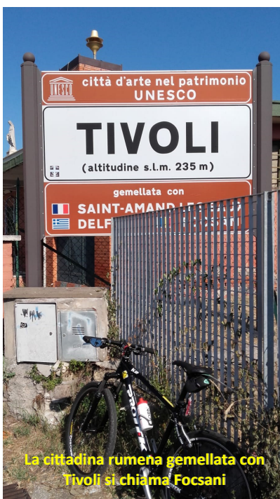
La cittadina rumena gemellata con Tivoli si chiama Focsani