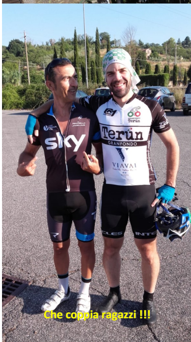
Che coppia ragazzi !!!