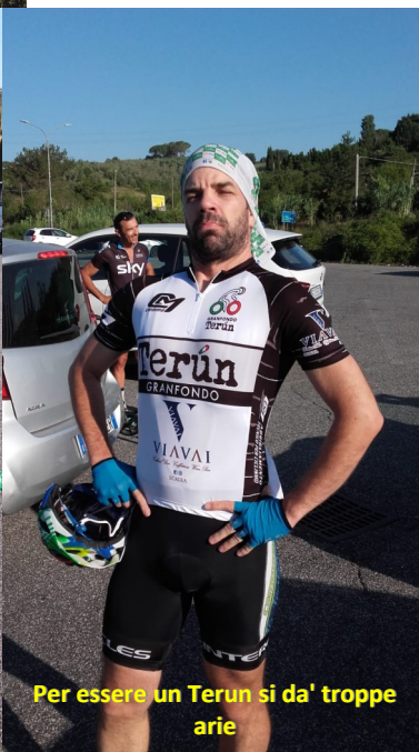
Per essere un Terun si da' troppe arie